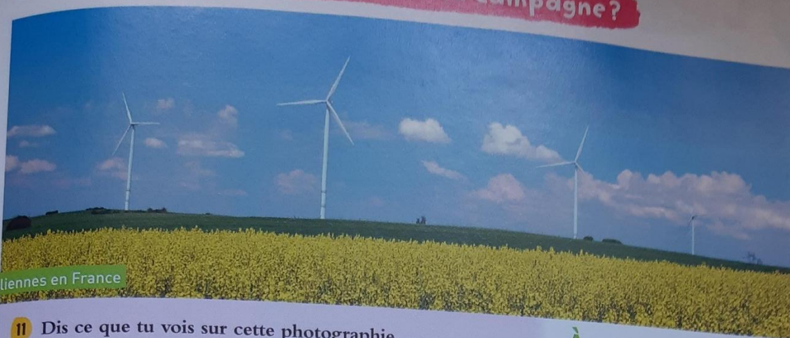
Éoliennes en France