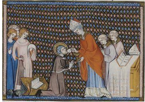
Communion de Louis IX, Vie et miracles de Saint Louis, G. de St. Pathus, XIVe siècle.