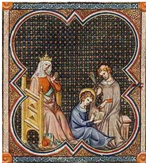
Leçon de lecture de Saint Louis, Grandes Chroniques, XIVe siècle