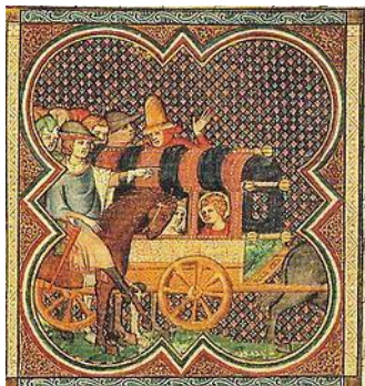
Louis et sa mère allant à Reims, id. XIVe siècle.

Né le 25 avril 1214 à Poissy, 44e roi de France, et neuvième issu de la dynastie des Capétiens directs, il est le cinquième enfant et quatrième fils connu du roi Louis VIII, dit « Louis le Lion » et de la reine Blanche de Castille, de laquelle il reçoit une éducation très stricte et très pieuse durant toute son enfance. Aîné des membres survivants de sa fratrie, il hérite de la couronne à la mort de son père, alors qu'il n'est âgé que de douze ans. Il est alors sacré le 29 novembre 1226 en la cathédrale de Reims, mais c'est la reine mère qui, conformément au testament de Louis VIII, exerce la régence du royaume jusqu'à la majorité du nouveau monarque.