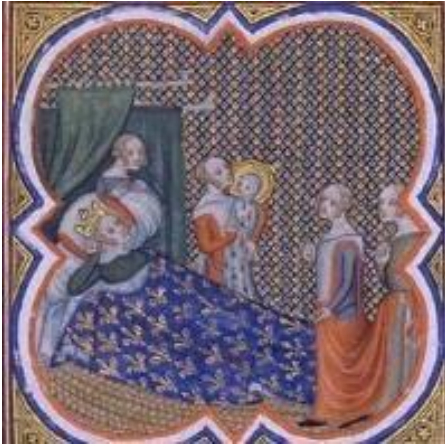
Naissance de Louis IX, Grandes Chroniques de France de Charles V, XIVe siècle.