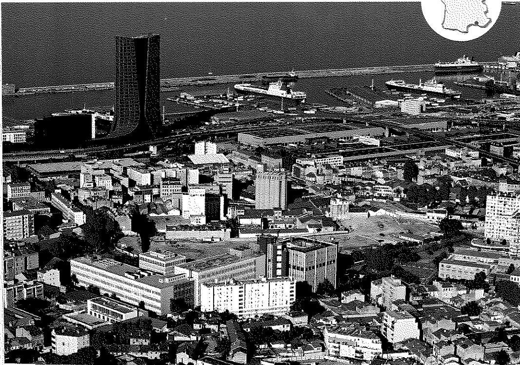
Doc. 3 La Joliette, le nouveau quartier d'affaires de Marseille dans les Bouches-du-Rhône (Provence-Alpes-Côte d'Azur)