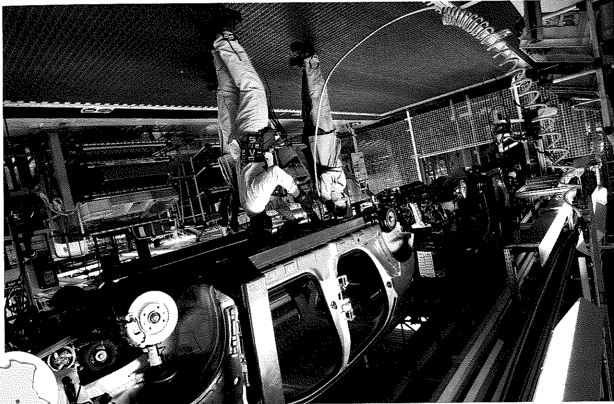
Doc. 1 Chaîne de montage dans une usine automobile de Poissy, dans les Yvelines (Ile-de-France)