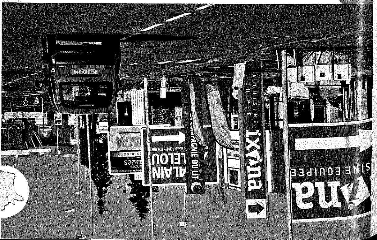
Doc. 4 Centre commercial au Mans dans la Sarthe (Pays- de la Loire)