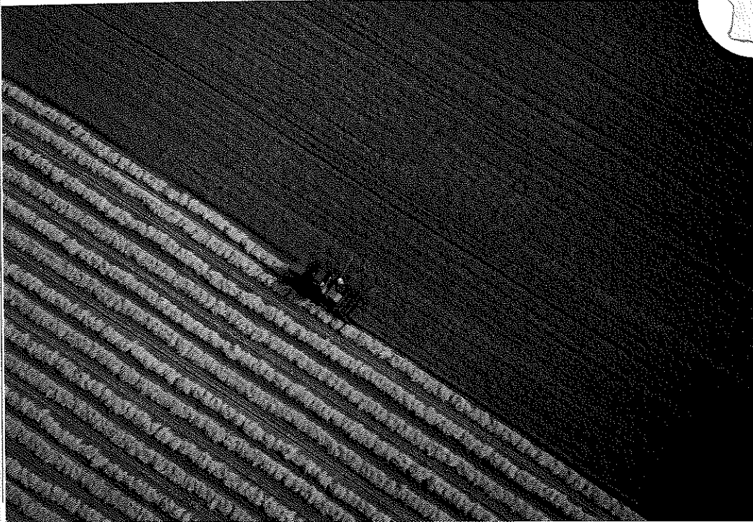
Doc. 2 Récolte de céréales en Indre-et-Loire (Centre-Val-de-Loire)

Je lis des photographies pour prélever des informations.