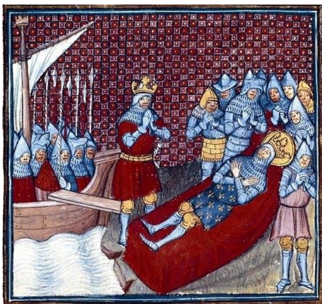
La mort de Saint Louis

Les échecs des croisades et la mort du roi signeront la fin des croisades pourtant commencée en 1095 suite à l'appel du pape Urbain II.